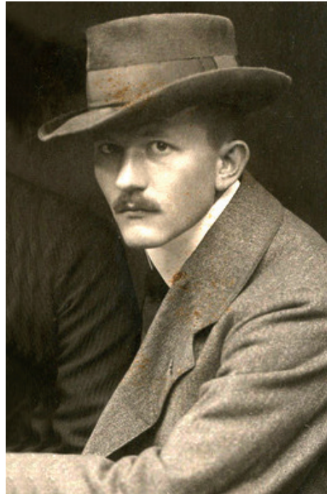
Revolverjournalist: »Die Leute verlassen sich jetzt auf die Zensur.«