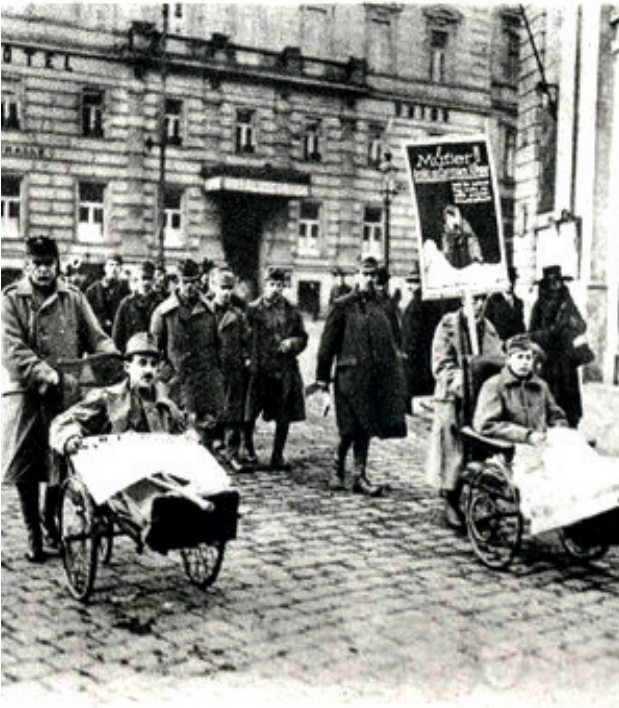
Kriegsinvaliden werden durch die Straßen geschoben