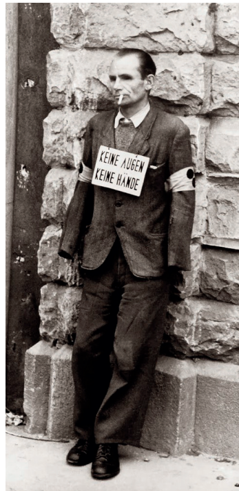
Blinder Soldat: »Entschuldigen – «