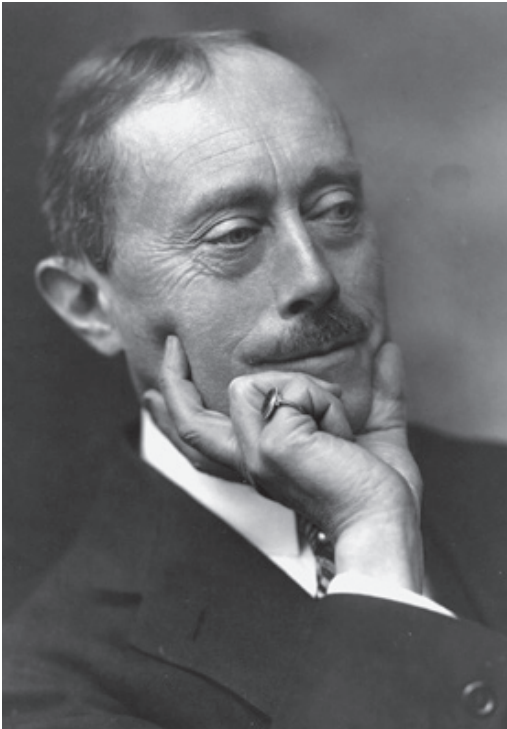
Agent: »Hat Budischovsky gewußt?«