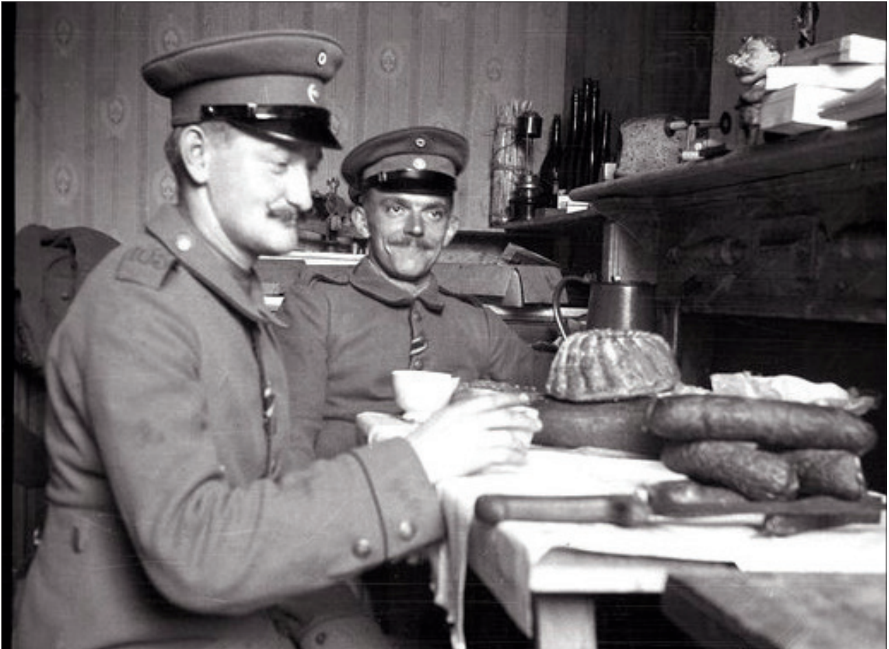
Fallota und Beinsteller bei Würsten und »Spehlmeis«: »Kennst schon den »Katzelmacher-Marsch«? Pomali, kann ich auswendig, hör zu. – «