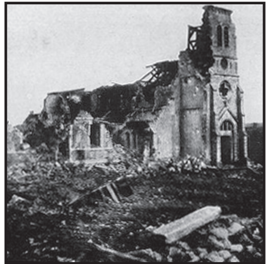
Von deutschen Truppen zerstörte Kirche bei Verdun