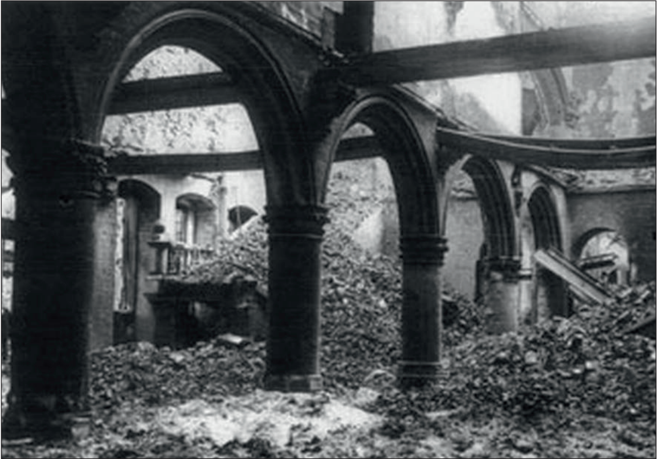
Von deutschen Truppen zerstörte Bibliothek im belgischen Löwen (August 1914)