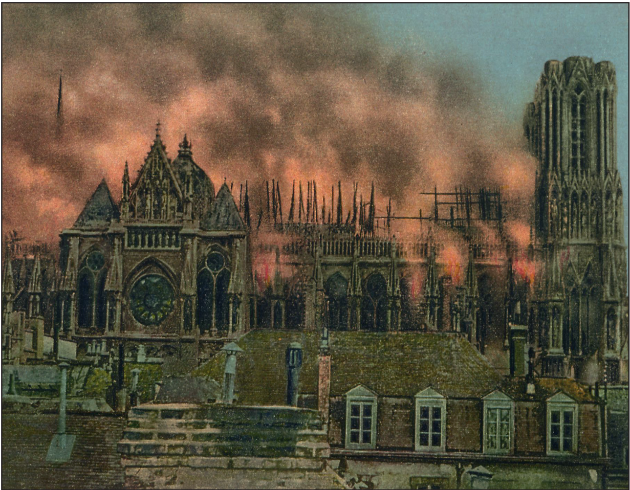
Die brennende Kathedrale von Reims (September 1914)