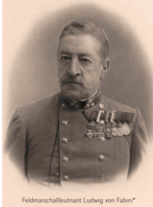
Feldmarschalleutnant Ludwig von Fabini*