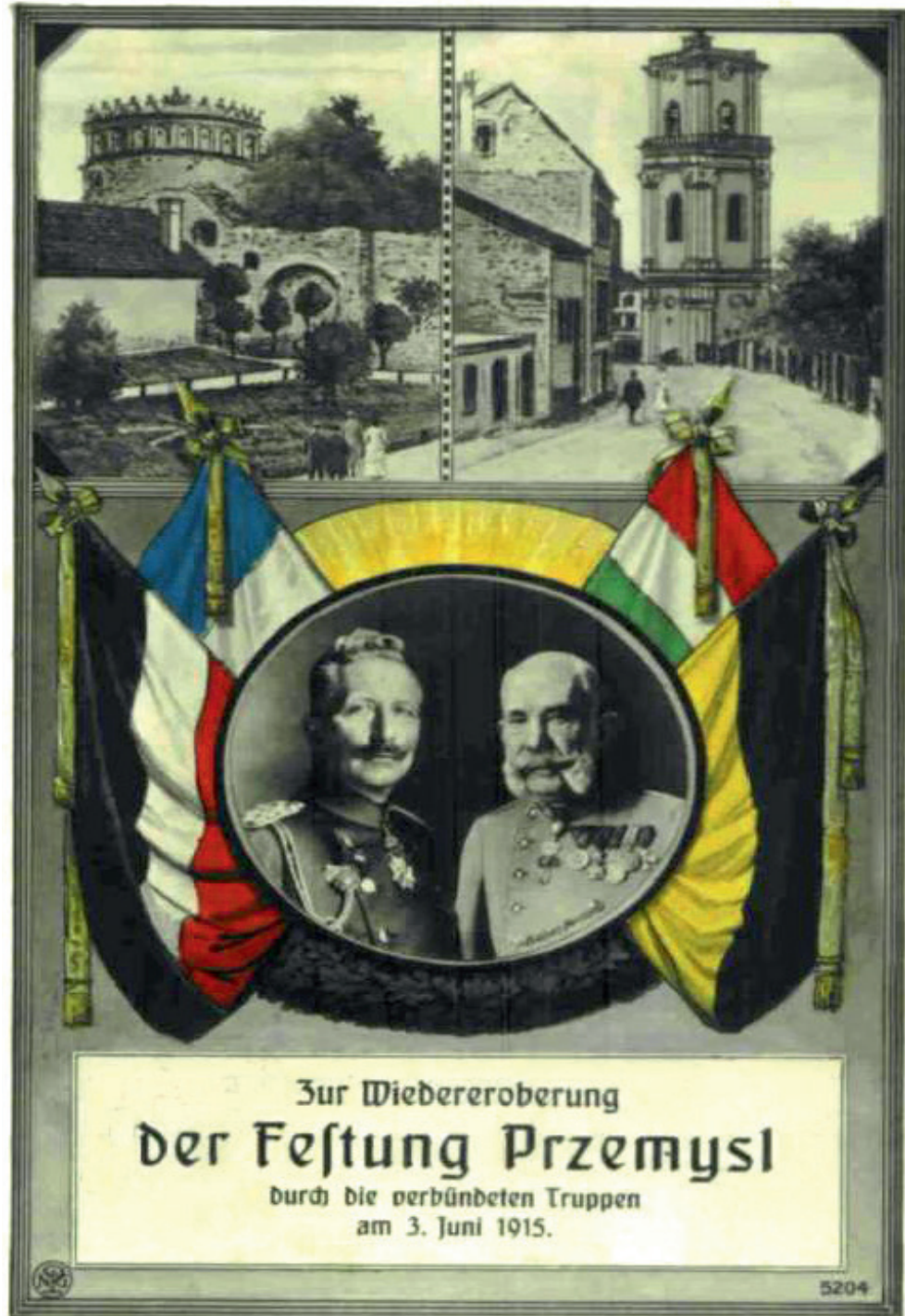
Propagandapostkarte zur Wiedereroberung von Przemysl (3. Juni 1915)

Ferner: Festung vollkommen intakt, unversehrt in unsern Besitz gelangt – modernste Geschütze – Wie? Man kann nicht vergessen machen? Altes Graffelwerk? Aber nein, jetzt nicht mehr natürlich! Alles kann man vergessen machen, lieber Freund! Also hör zu und mach kan Pallawatsch – modernste Festung – Österreichs alter Stolz – unversehrt zurückerobert. Nicht durch Gewalt, sondern durch Hunger, ah was red ich, nicht durch Hunger, sondern durch Gewalt! No wirst scho machen – wens nur den Leuteln einleuchtet – jetzt is ja eh leicht – also servus! Schluß!