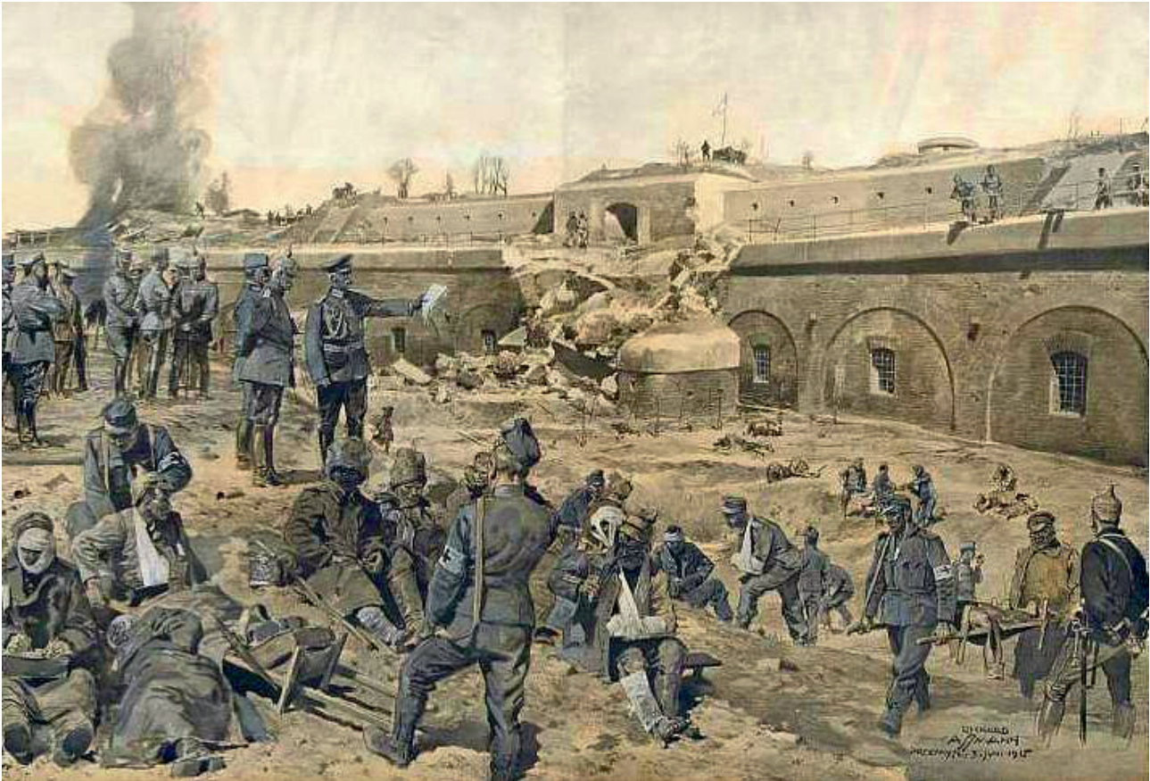
Feldmarschall Mackensen besichtigt am 3. Juni 1915 ein gestürmtes Aussenfort der wiedereroberten Festung Przemyśl