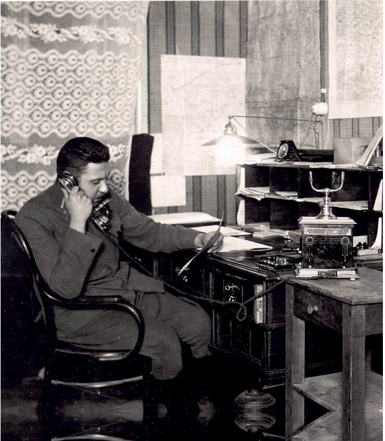
Generalstäbler beim Telefon: »Also hör zu und mach kan Pallawatsch – modernste Festung – Österreichs alter Stolz – unversehrt zurückerobert.«