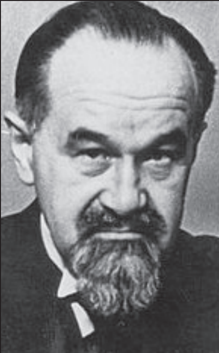
Psychiater: »Der Mann ist der eigenartigste Fall, der mir bis heute untergekommen ist.«