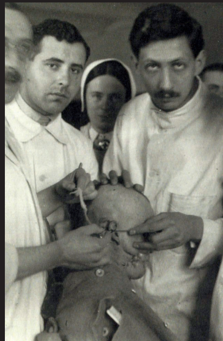
Patient wird untersucht