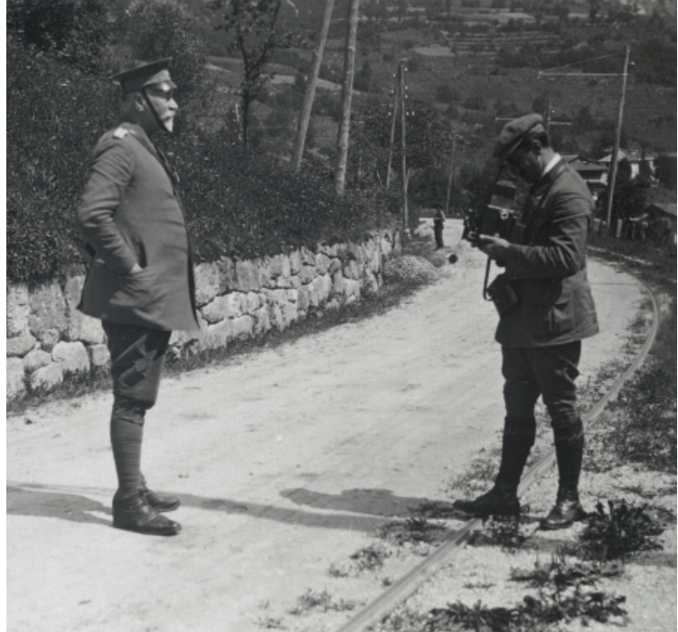
Journalist und alter General: »I hob nur g'hört – daß jetzt – die Preißen kummen.«

Alter General: »Die – ritte – dreitende – rati – tatita«