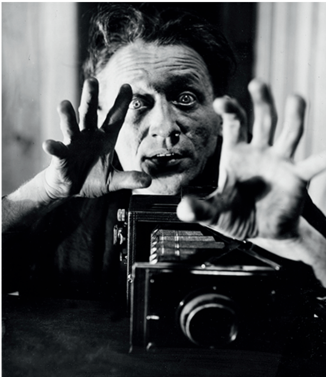
Sensationslüsterner Reporter mit Photoapparat: »Aus den Qualen der russischen Gefangenschaft erlöst weinte die Künstlerin Freudentränen bei dem Bewußtsein, wieder in ihrer geliebten Wienerstadt zu sein – «