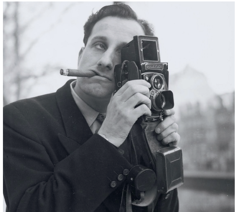
Reporter: »Wie war Ihre Rußlandreise?! Wir brauchen Einzelheiten, Details.«