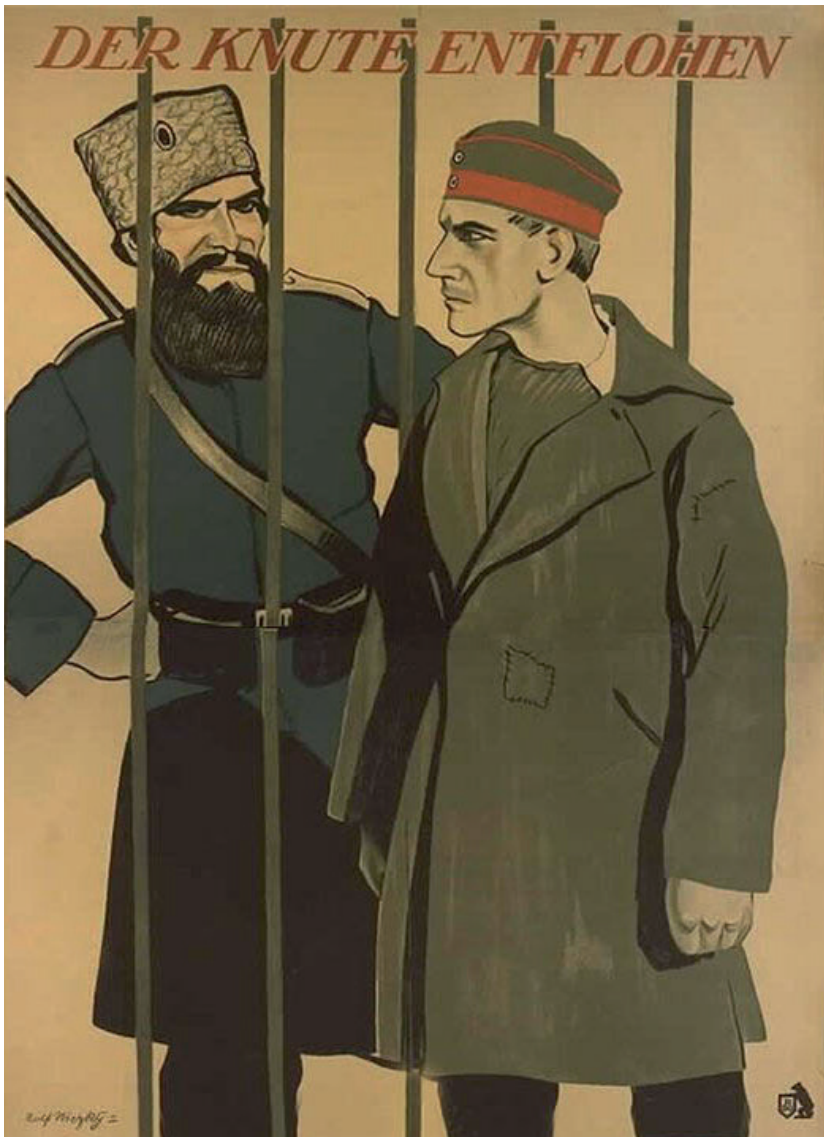
»Der Knute entflohen« (Filmplakat von 1917)