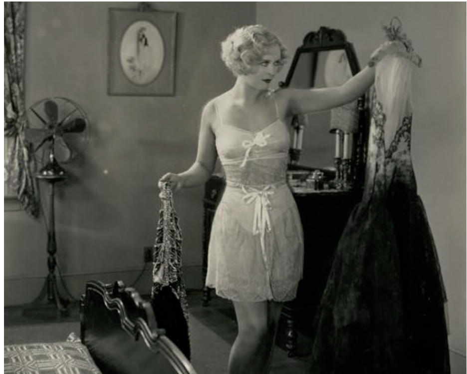
»Wissen Sie – ich als Frau hab ja auch gar nicht mal so den rechten – Überblick, nich wahr?«