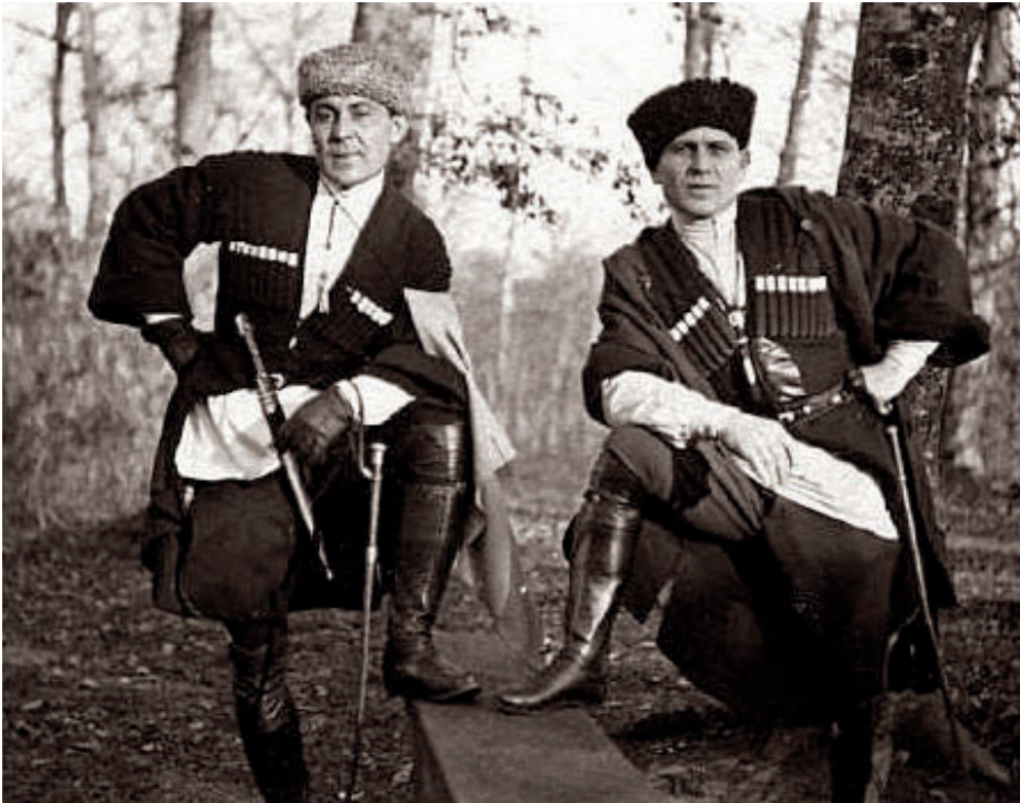
Russische Kosaken mit Nagaikas-Peitschen