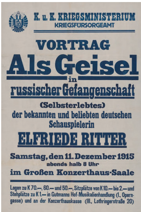
Vortrag »Als Geisel in russischer Gefangenschaft«

Intressant – eine langwierige Fahrt, also sie gibt zu –